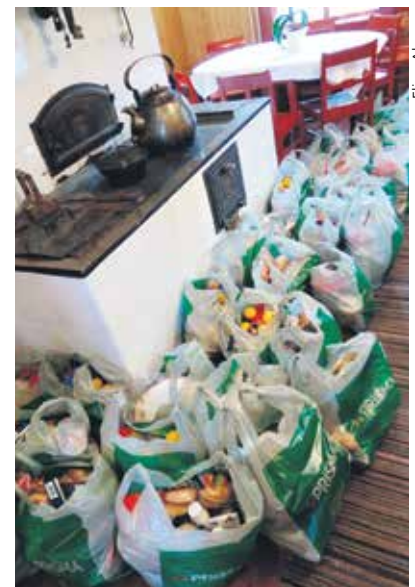
Aukeaman tekstit ja kuvat: Johanna Manner.

KRS tekee opiskelijatyötä Helsingissä, Jyväskylässä ja Turussa. opiskelijat.fi